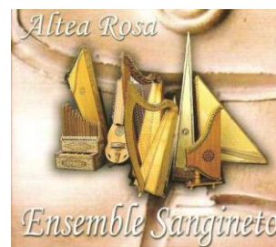
Altea Rosa 2006 (LP)