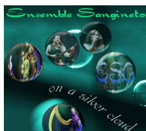
On a Silver Cloud 2013 (LP)