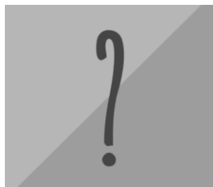
Le Grand Tour 2021 (LP)