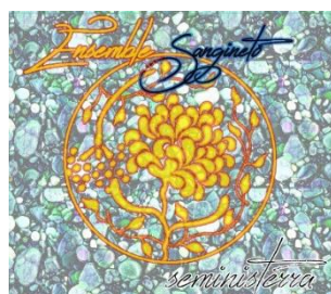
Seministerra 2015 (LP)