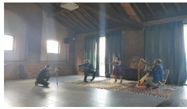
"Rinello" Le Grand Tour