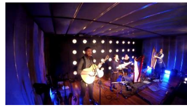
"Lusive La Lune" If on a Harp Night 2020

Hùg Air A' Bhonaid Mhòir // Canto Scozzese