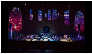
"Abbraccio di Sale" Sferisterio Folk 2020